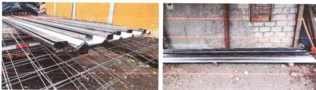
Duratecho espesor 0.30mm X 1.115m largo 6m.