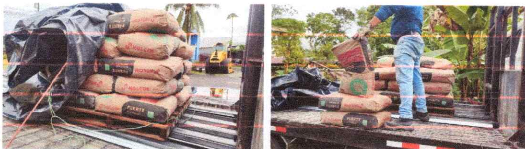
Cemento portland gris 50 kg