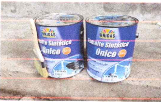
Pintura anticorrosiva negro mate