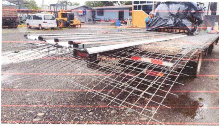
Malla electrosoldada R-158 5.5 15x15 (2.4X6.25m)