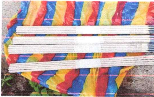
Electrodos 60/11 e 4 mm