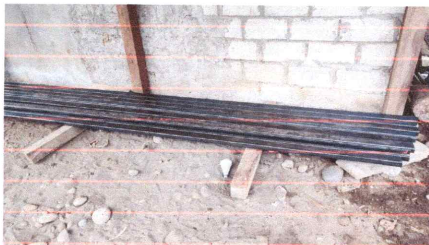
Perfil estructural correa tipo G (80X40X15X2)