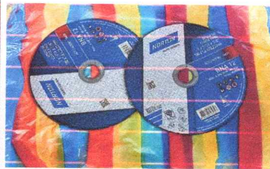
Disco de corte para metal