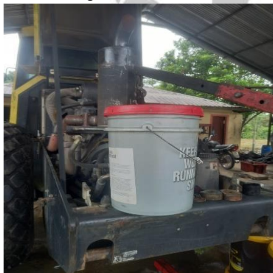
Reemplazar filtro de aceite motor, Reemplazar filtro de combustible