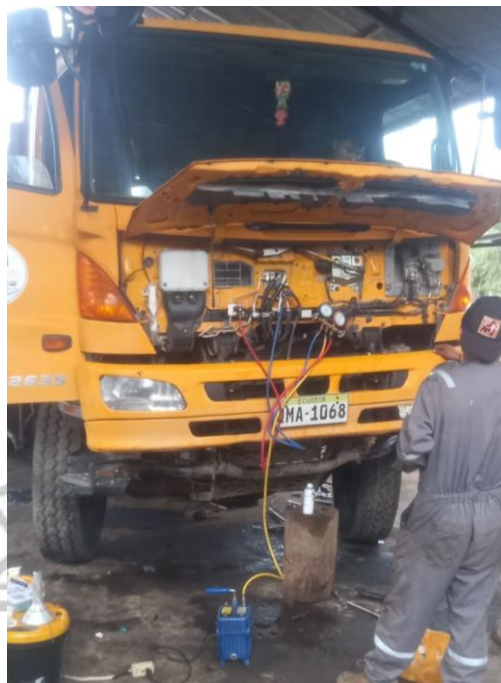
Remplazar filtros de aceite de motor primario, secundario