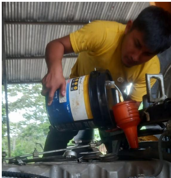
Cambio aceite de la transmisión