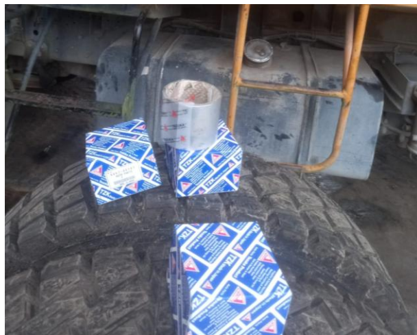
Remplazar los retenedores de las chumaceras