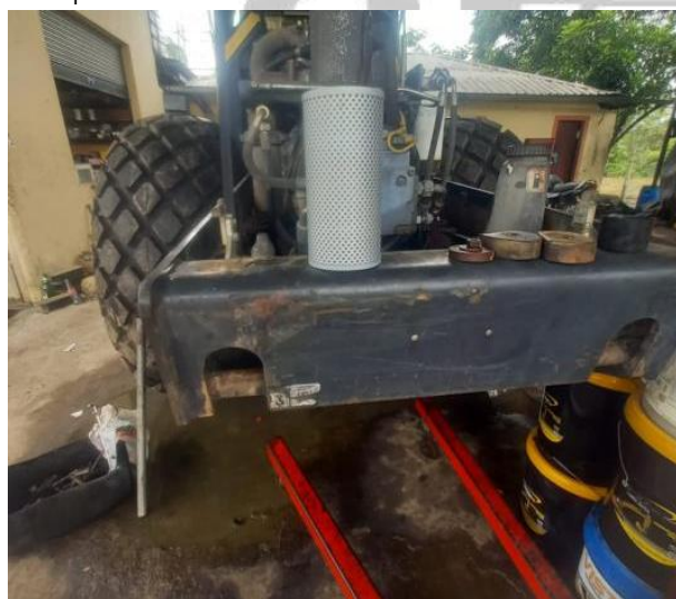
Reemplazar filtro de aire acondicionado