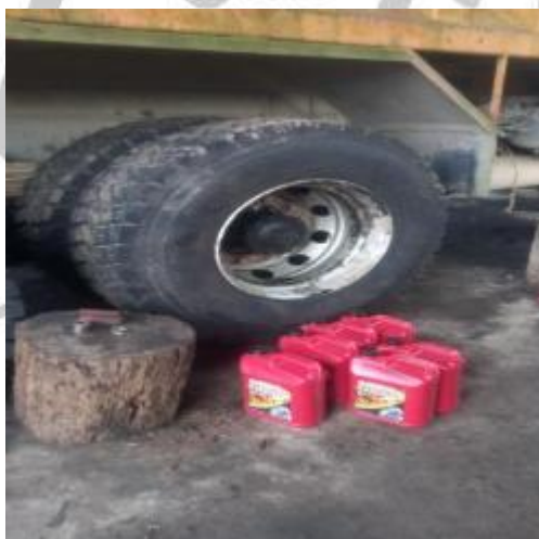
Cambio aceite de los diferenciales