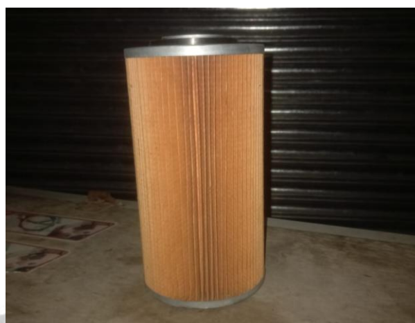
Remplazar filtro de aire primario, secundario