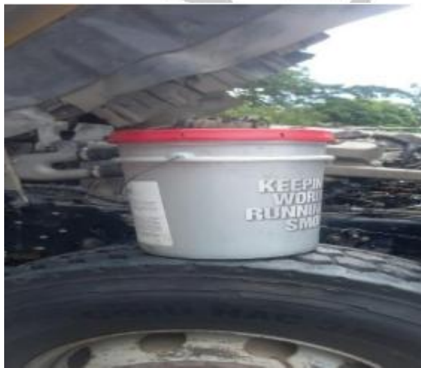
Engrasada de las puntas de eje de la dirección, eje posterior