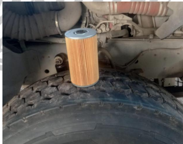
Remplazar filtro de combustible primario, secundario