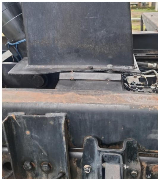
Reemplazar raches de freno posterior y delanteros